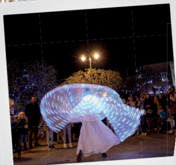
Lancement des illuminations de Noël