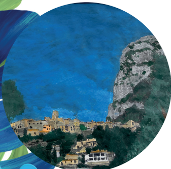
1 er prix Lilas-Rose Angaut-Krasa

Félicitations aux heureuses gagnantes, nous nous retrouvons au Festival Arts et Sports le dimanche 3 juillet pour la remise des prix !