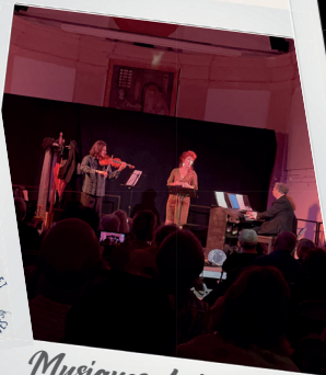
Musiques de films