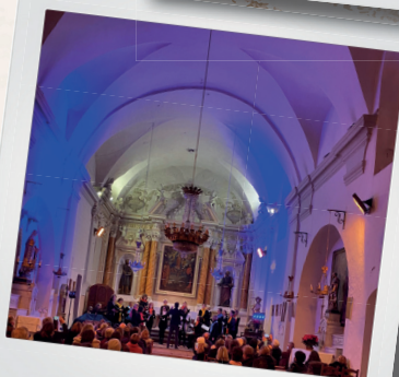
Choeur de femmes