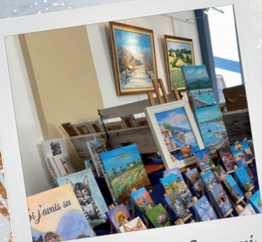
Exposition Line Germani