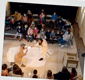
Le monde point à la ligne