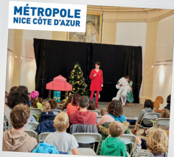
Spectacle enfants Le Noël de Kamishibai