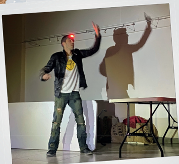
Projet Collapse 1