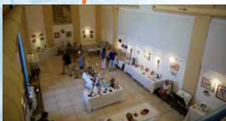
« Des couleurs et des formes » par l'Atelier de La Gaude