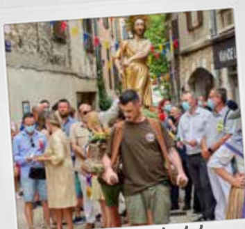
Fête patronale de la Saint Jean-Baptiste