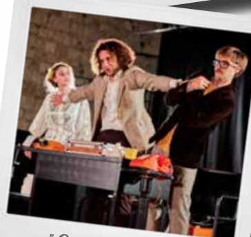
"On purge bébé"