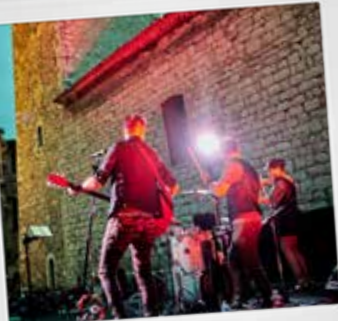
Concert "Irish Comrades"