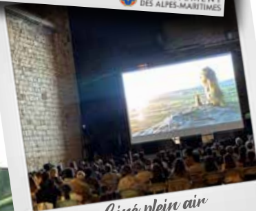
Ciné plein air "Le roi lion"