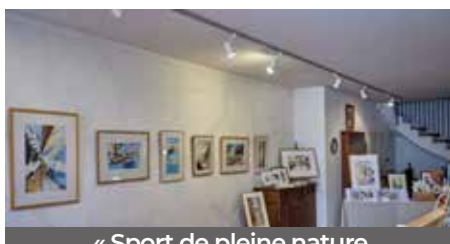
« Sport de pleine nature et aquarelles » par Evelyne Bovis