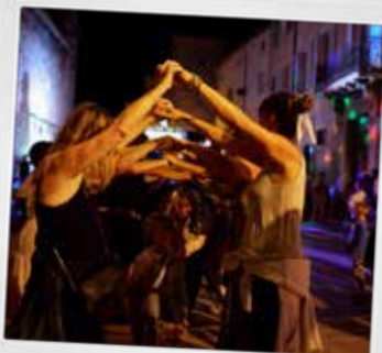
Bal de la fête nationale