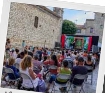
"La véritable vraie histoire vraie du chat botté"