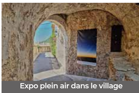
Expo plein air dans le village