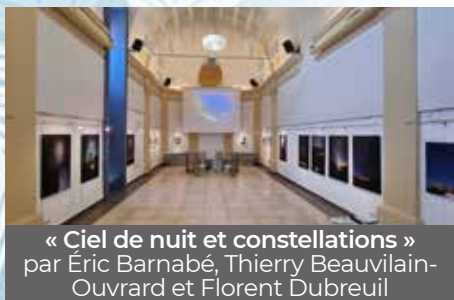
« Ciel de nuit et constellations » par Éric Barnabé, Thierry Beauvilain- Ouvrard et Florent Dubreuil