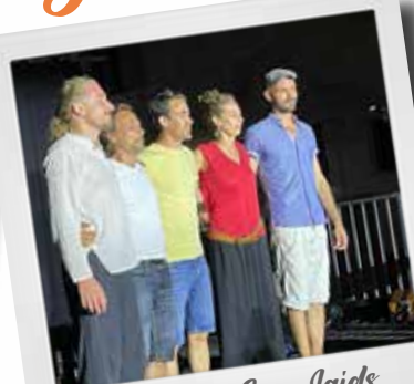
Les P'tits Gars Laids